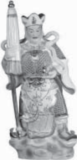
Dai Bishamon Tenno / Vaishravana ~ Raja Langit Utara ~