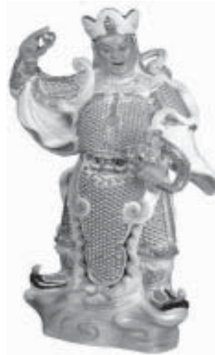
Dai Komoku Tenno / Virupaksha ~ Raja Langit Barat ~