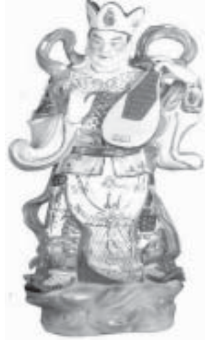
Dai Jikoku Tenno / Dhritarashtra ~ Raja Langit Timur ~