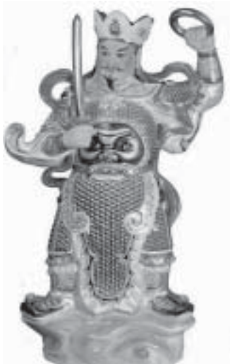
Dai Zochō Tenno / Virudhaka ~ Raja Langit Selatan ~